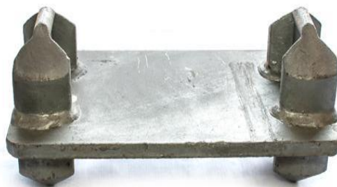
Gambar 2. 9 Double Stacking Double Bridge Cones.

Alat ini berbentuk kerucut dan berfungsi sebagai pengikat penahan peti kemas, dipasang pada bagian atas maupun bawah kontainer. Alat kerucut ini membantu menahan kontainer agar tetap berada pada posisi yang stabil selama pelayaran, mencegah pergeseran akibat gerakan kapal, gelombang, atau angin. Dengan pemasangan yang tepat, alat ini berperan penting dalam menjaga keselamatan muatan dan kestabilan kapal secara keseluruhan. Selain itu, keberadaan alat ini mempermudah penumpukan kontainer secara vertikal dan memastikan setiap lapisan kontainer terkunci dengan aman, sehingga mengurangi risiko kerusakan muatan maupun potensi kecelakaan di atas dek.