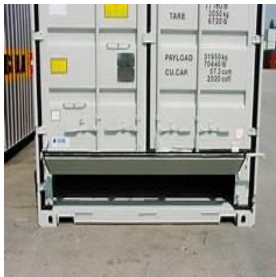
Gambar 2. 4 Dry Bulk Kontainer