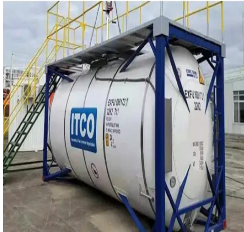
Gambar 2. 3 Tank Kontainer