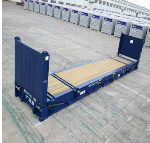
Gambar 2. 5 Flat Rack Kontainer