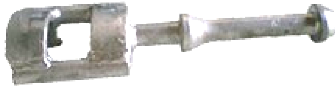
Gambar 2. 16 Extention Hook .

Alat ini digunakan untuk menyambung lashing rod yang tidak mencukupi untuk melashing peti kemas high cube .