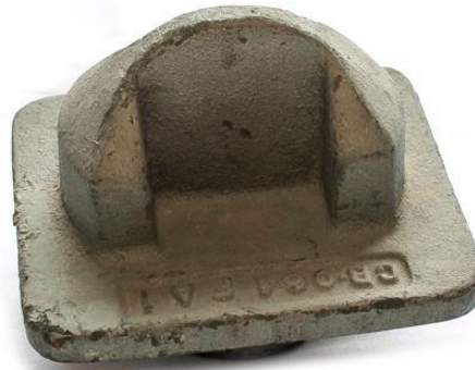
Gambar 2. 7 Single Bridge Base cone