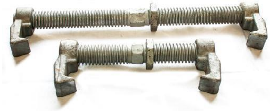
Gambar 2. 13 Screw Bridge Fitting.