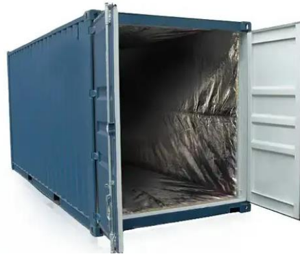
Gambar 2. 2 Thermal Kontainer