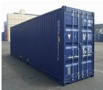
Gambar 2. 1 General Cargo Kontainer