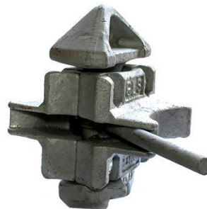
Gambar 2. 12 Twist Lock.

Alat yang digunakan untuk mengikat peti kemas yang disusun menumpuk keatas.