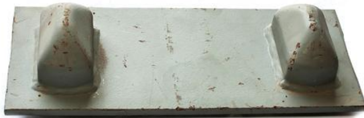
Gambar 2. 8 Double Bridge Base cone