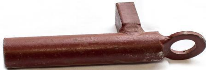
Gambar 2. 10 Deck Pin atau Deck Locking Pirn.

Alat ini digunakan untuk menahan bagian dasar peti kemas setelah ditempatkan di dalam base cone. Fungsinya adalah memastikan kontainer tetap terkunci dengan kuat pada posisinya, sehingga tidak bergeser selama pelayaran, terutama ketika kapal menghadapi gelombang tinggi atau gerakan yang tidak stabil. Penggunaan alat ini sangat penting untuk menjaga keamanan muatan serta kestabilan tumpukan kontainer, sekaligus meminimalkan risiko kerusakan atau kecelakaan. Dengan pemasangan yang tepat, alat ini juga mempermudah proses pemuatan dan pembongkaran, karena setiap kontainer dapat diposisikan dengan presisi dan aman dalam struktur tumpukan.