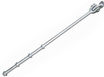
Gambar 2. 15 Lashing rod .