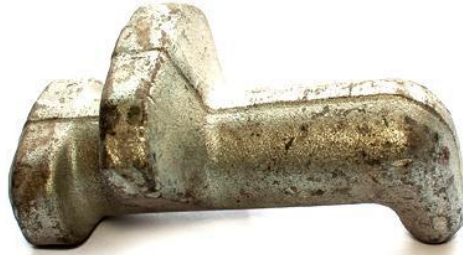
Gambar 2. 11 Pigeon Hook.

dapat dipasang dengan tepat, sehingga keamanan muatan, kestabilan kapal, dan keselamatan awak kapal dapat terjaga secara optimal selama pelayaran.