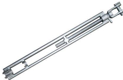
Gambar 2. 14 Screw Bridge Fitting.

Alat yang dihubungkan dengan lashing rod dan bila bagian tengahnya diputar maka kedua batang terulir akan berputar mengencang maupun mengendor.